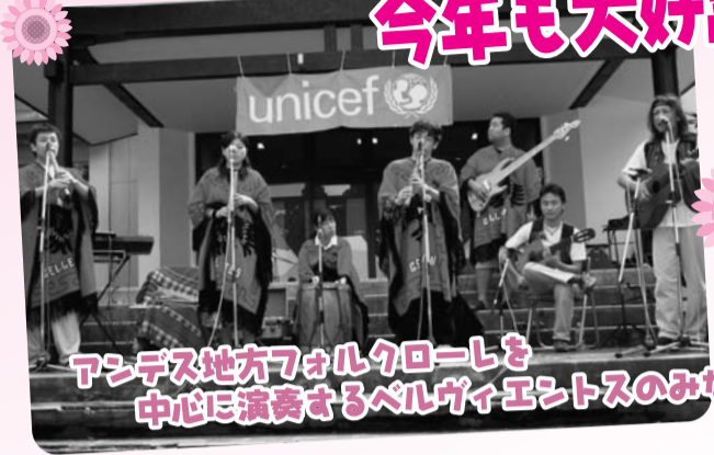
アンデス地方フォルクローレを中心に演奏するペルヴィエントスのみなさん。

ユニセフチャリティーオークションで寄せられたお金は「ジャワ島地震緊急募金」に贈呈されました。